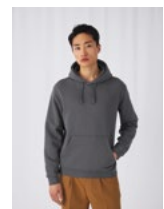
ERHÄLTICH IN UNISEX B&C HOODED