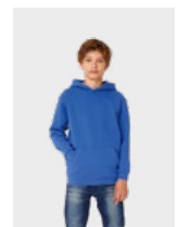
ERHÄLTICH IN KIDS: B&C HOODED /KIDS