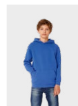
ESISTE IN KIDS: B&C HOODED /KIDS