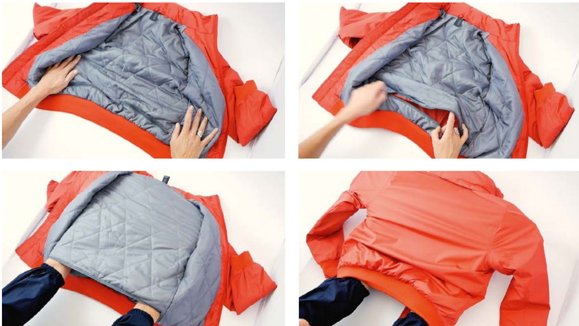
Cerniera frontale con orlo ad aletta.