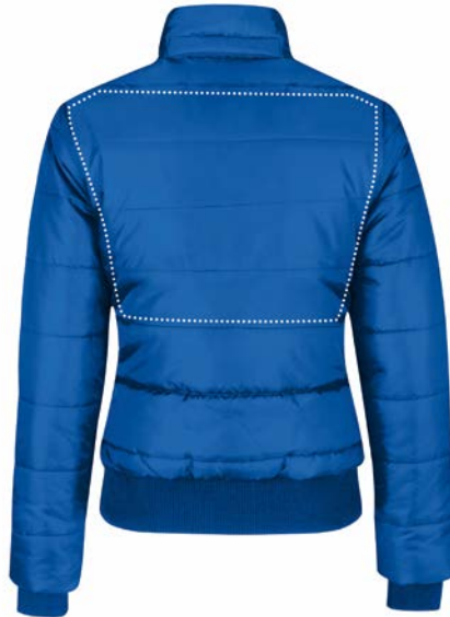
Bovenkant van het rugpand