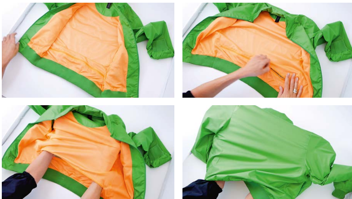
Fermeture Éclair en bas du dos.